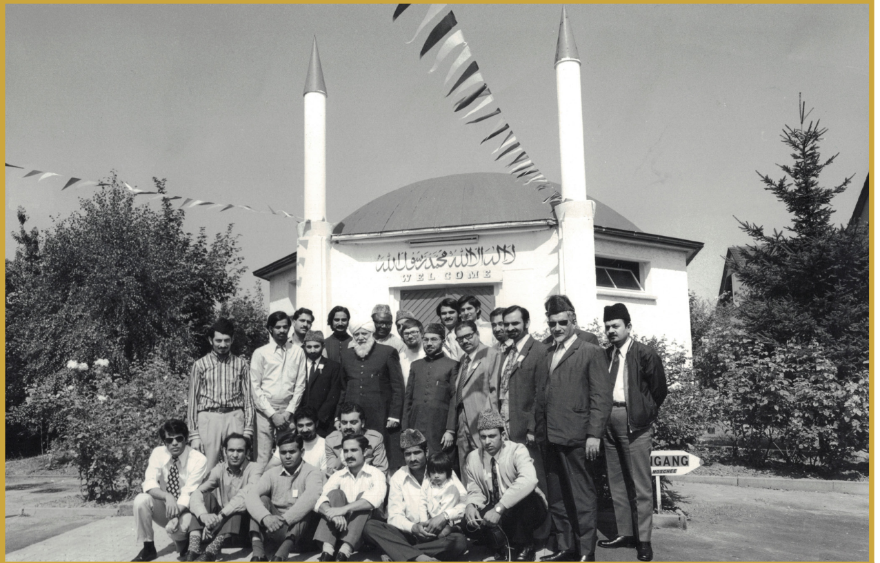
حضرت خلیفۃ المسیح الثالث رحمۃ اللہ علیہ دورہ جرمنی 1973ء کے دوران مسجد نور فرانتکرفٹ کے سامنے احباب جماعت کے درمیان